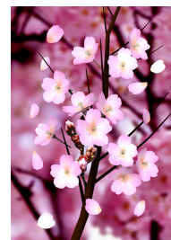
作品①「Sakura」 DiGi Monkey

兵庫県出身。絵本のように物語が浮かんでくるような作品の創作をモットーに関西を中心に活動中。