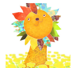
作品④「ライオン」 えこっちょ