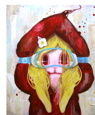
作品③「赤い瞳に写るもの」 momo