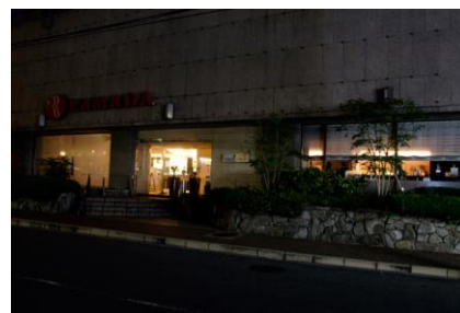
※画像は2010年3月に行われた「アースアワー」での消灯の様子です。